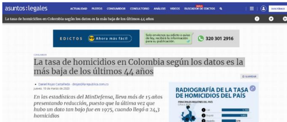
Figura N. 3 Celebración de índice de homicidios dados en miles, dan cuenta de la mentalidad violenta del país

El mayor rubro de inversión pública, lastimosamente debería ser encaminado a la fuerza pública y a las fuerzas armadas, cuando los líderes políticos dirigentes y la población civil en general comprendan que solamente fortaleciendo la política criminal colombiana, con recursos e inversión se logra defender el derecho fundamental a la vida. Cuando el bien máspreciado para la sociedad sea la vida. Cuando la vida de la población está vulnerada a diario y cifras de muertes están dadas en miles de muertes por año. Cuando los periódicos celebran y se conforman con una baja insubstancial en las estadísticas. Solo cuando los líderes políticos y la población en general se concienticen que la cifra debe darse en cientos, y que deben juntarse todos los esfuerzos para lograr con prioridad esta meta, solo en ese instante iniciarán a dar resultados, con verdaderas estadísticas hacia la baja.