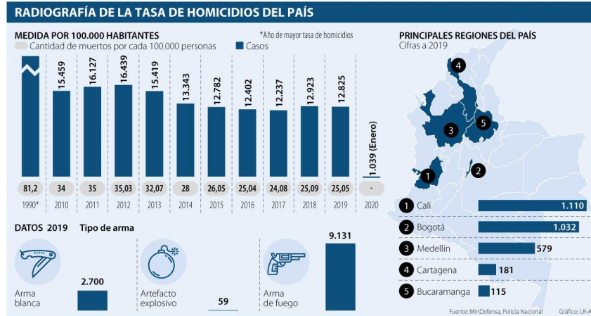
Tabla N. 2: Radiografía de la tasa de homicidios del país 1990-2020