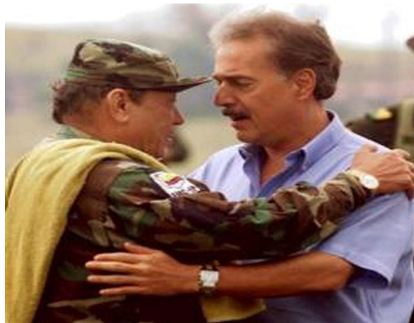
Figura N. 1: Presidente de Colombia Gaviria, abrazado con Tirofijo.

La historia trae consigo imágenes que resumen una historia dolorosa. Una de ellas es la siguiente fotografía. Mientras miles de muertes, atentados terroristas, secuestros, reclutamiento ilegal de personas incluidos niños y niñas, violaciones, robo de los bienes y tierras que las personas habían heredado por generaciones; además de añadirle, el desplazamiento forzado y terrorismo nacional y, ante estas matanzas se presenta el presidente Gaviria abrazado con alias Tirofijo, el líder y responsable de este holocausto de la raza colombiana.